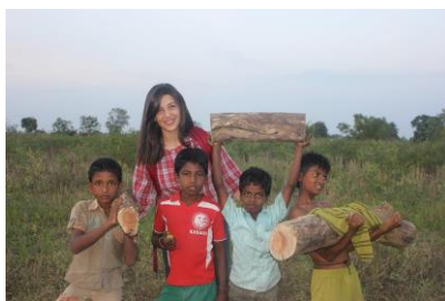
Mission courte Inde