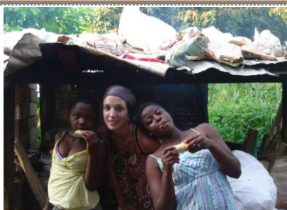
Mission courte au Cameroun